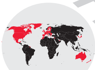
■ Países que negocian el ACTA.

ACTA se presentó como un tratado amplio sobre falsificación de marcas y bienes físicos, pero el secretismo de las negociaciones y las últimas filtraciones, confirman un objetivo siniestro del acuerdo: instaurar un estado policial sobre internet , criminalizando y restringiendo la libre circulación de la información.